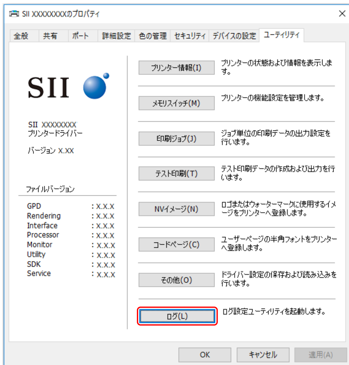
図 3-1 [ユーティリティ]画面